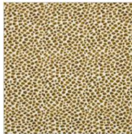
LA PECHE AUX EPONGES Velours texturé M117801