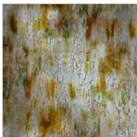
LA CLOSERIE DES LILAS Velours texturé M119001