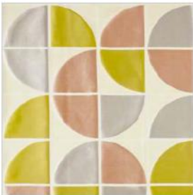
OCEAN DRIVE Soie M110101