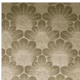
PALMETTE ART Velours imprimé M118204