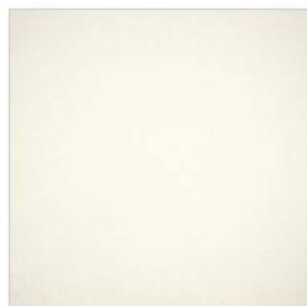
MARDI DE POESIE Voile M120302