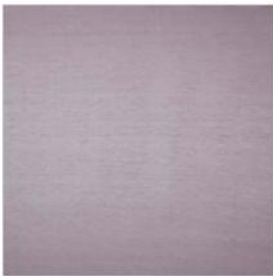
BAHAMA VILLAGE Satin M105006