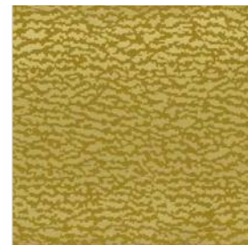
CLINQUANTE COUPOLE Revêtement mural M102403