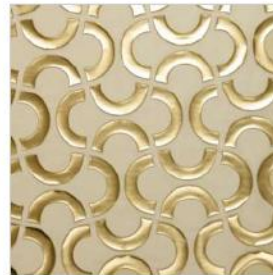
OVERSEAS Voile laminé M106601