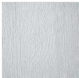
ESQUISSE AU MUR Satin M111403