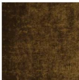
AU MONT DES MUSES Velours uni M104007