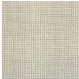
DRY TORTUGAS Tissu texturé M103503