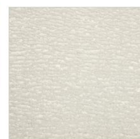
REVE DE ROTONDE Tissu texturé M107903