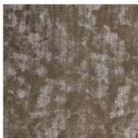
LUMIÈRES DE VILLE Velours laminé M100001