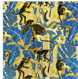
CAPUCIN Velours imprimé M123703