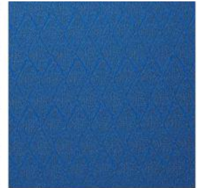
PACO'S SUIT Soie texturée M112604