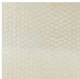
BAL BULLIER Voile métallisée M121402