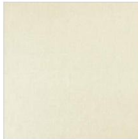
LE VOILE DE PAULINE Voile de lin M108902