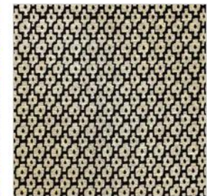
CAYO HUESO Tissu texturé M109002